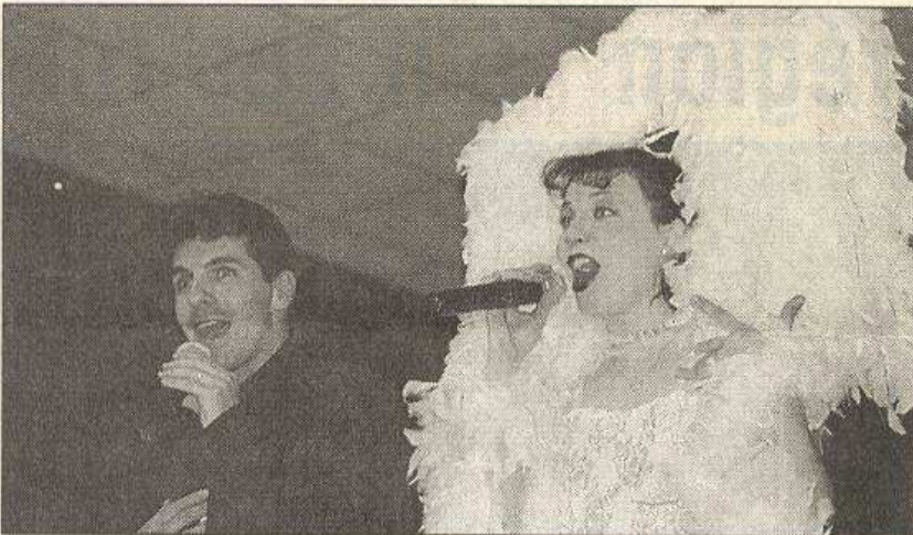
Deux artistes de talent.

S amedi, en soirée, la chorale des Compagnons de la Sanne, qui rassemble des choristes des quatre villages : Assieu, La Chapelle, Saint-Romain, Ville-sous-Anjou, et des villages voisins, a organisé sa première soirée cabaret à la salle des fêtes du village.